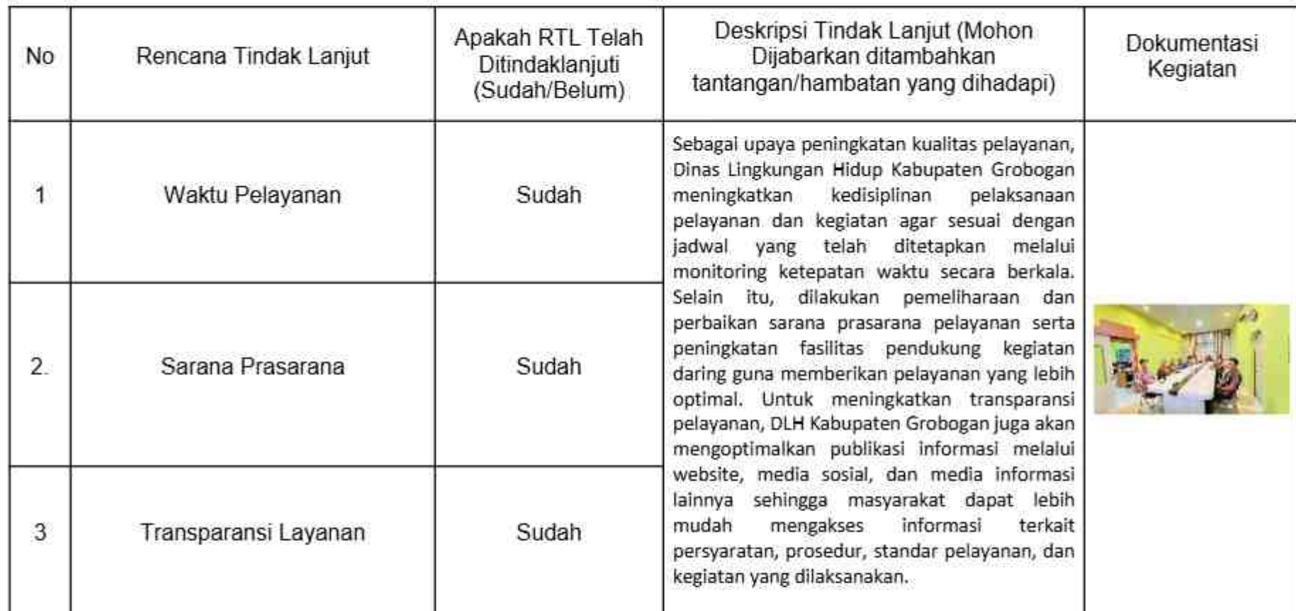
Tabel 5. Rencana Tindak Lanjut